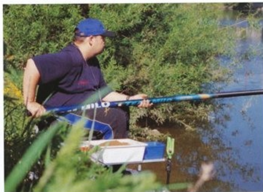
S děličkou lovíme naprosto přesně: precizní rybolov od strany 6.