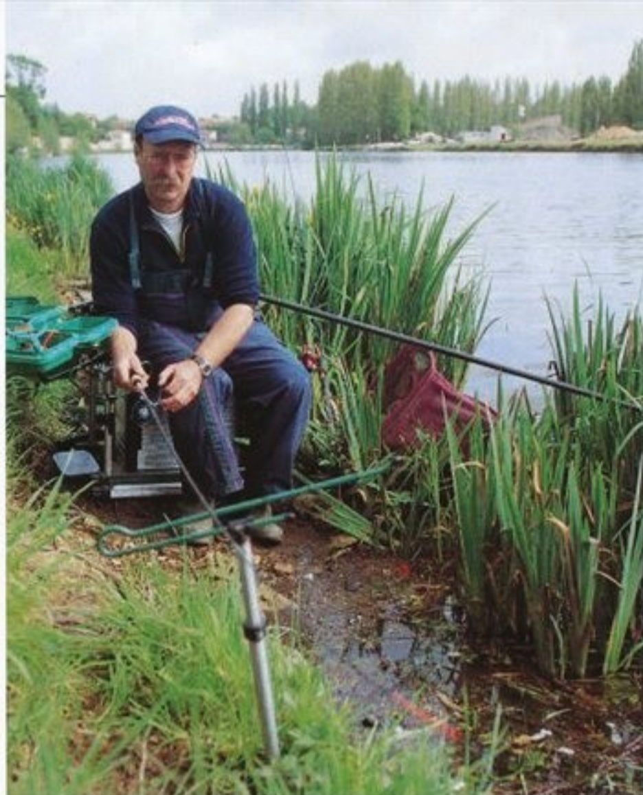
Vždy to nemusí být splávek: moderní položená od strany 50.