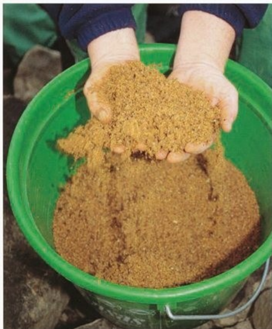
Vnudit jako profesionálové: nejlepší komponenty do krmení a triky od strany 66.