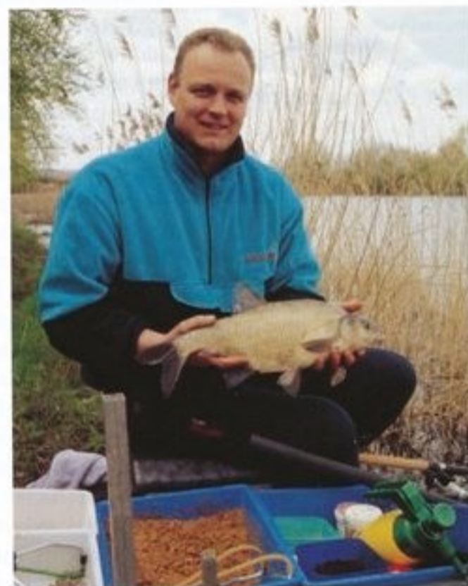
Blízko či daleko, na mělčině nebo v hloubce: mnohostrannost zaručena. Od strany 22.